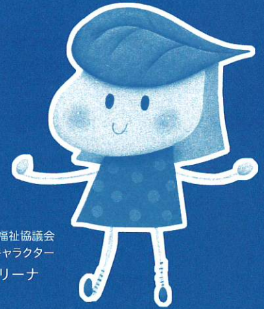
千種区社会福祉協議会 マスコットキャラクター ユーカリナ

千種区社会福祉協議会では、区民の皆様とともに地域福祉を推進するにあたり、地域での福祉事業を支援するため、会員としてその経費にご協力いただく賛助会員を広く募集いたします。