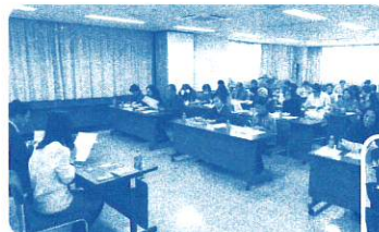
▲推進協研修会の様子