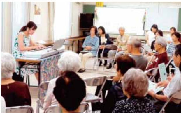
ふれあいの会《花の輪》ミニコンサート