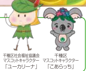
千種区社会福祉協議会 マスコットキャラクター 「ユーカリナ」