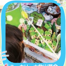
ユーカーリーナ救出募金