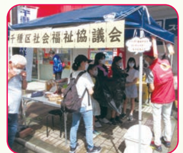
いきいき今池お祭りウィーク2022

9月18,19日に行われた「いきいき今池お祭りウィーク2022」に初めて参加しました。3年ぶりの開催ということもあり、とても賑やかで地元の方から愛されているお祭りだと感じました。19日は悪天候のため中止となりましたが、18日はなんとか天候にも恵まれ、社協ブースに多くの方に立ち寄っていただきました。「災害ボランティアちくさネットワーク」のみなさんの協力のもと、非常食の展示をはじめ、いざ災害が発生した際に困る「トイレ」のお話しと明治安田生命保険相互会社様からいただいた凝固剤などを配布し、防災啓発活動を行いました。また、ユーカリリーナ救出ゲーム、ガチャガチャなどを設置し、子どもたちに楽しんでいただくとともに、社協広報誌や地域デビュー冊子なども配布しながら、地域福祉活動などのPRにも務めました。“食べることも大事だけど、出すほうのことも考えなきゃね” “社協ってはじめて知った。いろいろなボランティア活動があるんだね” などと言った声も聞かれ、今回の参加はとっっても有意義な機会となりました。今後も機会を捉え、いろいろなイベントに参加しながら、社協のPRとともに地域福祉活動につながる広報に取り組んでいきたいです。