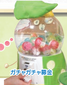
ガチャガチャ募金