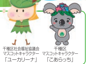
千種区社会福祉協議会 マスコットキャラクター「ユーカーリーナ」