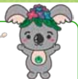
千種区 マスコットキャラクター 「こあらっち」