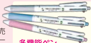
多機能ペン 色は水色とピンクと グレーの3色です。

千種区共同募金委員会は、売り上げの一部が募金になる“ユーカリリーナグッズ”を販売しております。トートバッグ、サコッシュ、ストラップ、巾着袋などバリエーション豊富で、多くのおみなさんにご愛用いただいております。今回、みなさんにご紹介するのは、“多機能ペン(1本500円)”! ご購入されたみなさんから“使いやすいわ〜”“孫にあげたら喜ばれたよ”などのお声もいただいております。詳しいことは、下記までお問合せください。