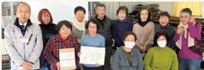
認定事業 「サロンうり坊」にて