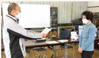
(右)感謝状を受けとる 蛭川地域福祉推進協 議会展長

千代田橋学区は地域支えあい事業実施6年目を迎え、その地域福祉推進の功績に感謝の意を表し、名古屋市社会福祉協議会会長の感謝状と記念品を伝達いたしました!