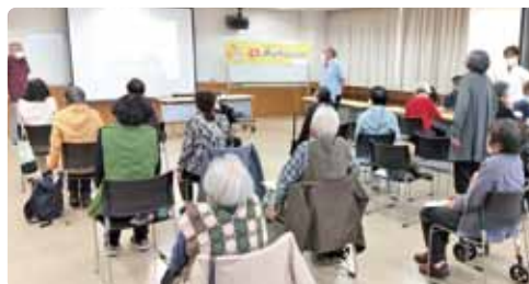
オーラルフレイル予防教室(体操と検査の様子)

令和4年11月10日千種区在宅サービスセンターで、千種区歯科医師会による「お口の健康年齢を測ってみませんか?」という内容のイベントが開催され、30名が参加されました。実際に口腔機能の検査を行い、オーラルフレイル(お口の虚弱)を予防する方法を学びました。