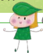
千種区社会福祉協議会 マスコットキャラクター 「ユーカリナ」