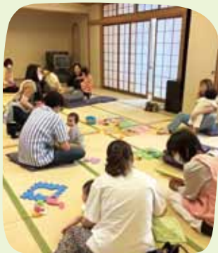
ベビー&マタニティサロン 香流橋