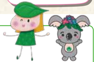
千種区社会福祉協議会 マスコットキャラクター「ユーカリーナ」