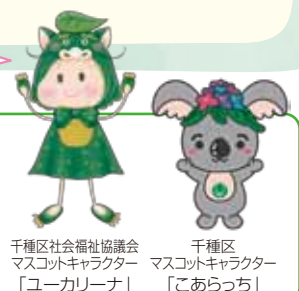
千種区社会福祉協議会 マスコットキャラクター 「ユーカリナ」