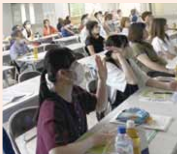
令和5年度 富士見台学区 地域支えあい研修 ～認知症サポーター養成講座～

ある高齢の住民の方から、「給湯器の電源がつかないよ～」と会館に連絡があり、ボランティアさんが駆けつけました。原因を探ってみると…電池がさかさまでした。住民の方もボランティアさんも顔を見合わせて笑い、おおごとにならずよかったと胸をなでおろしました。住民の方からは、「すぐに来てくれて助かりました。ご近所の方なので、家の中に入っていただくのも安心です。」とお話されています。